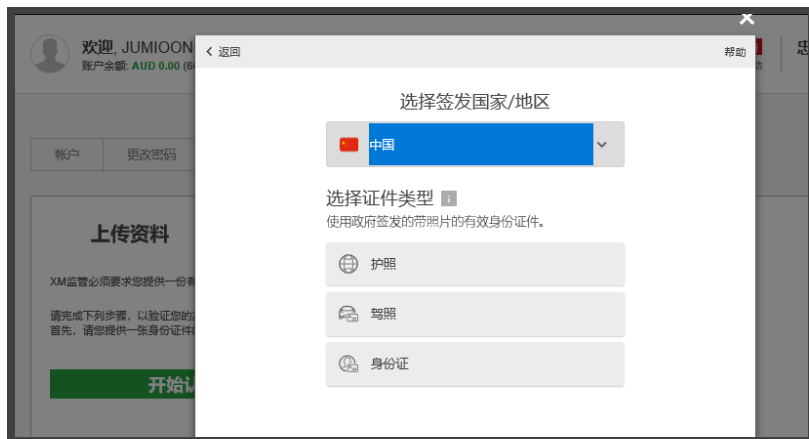
图5：国家和证件类型选择界面